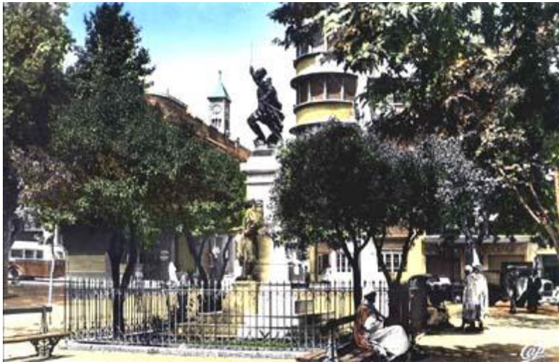
[Tiaret : statue de Lamoricière]

Si vous souhaitez en savoir plus sur TIARET, cliquez SVP, au choix, sur l'un de ces liens :