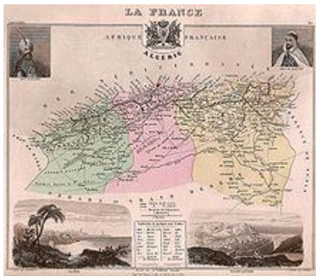
[Carte Française montrant les trois provinces d'Algérie, circa 1848]

L'Algérie, officiellement annexée par la France en 1848, fut partagée le 9 décembre de la même année en trois provinces, comprenant trois territoires militaires et trois territoires civils érigés en départements : Oran , Alger et Constantine, dont la loi du 24 décembre 1902 fixa durablement les limites jusqu'à la réforme territoriale de 1956.